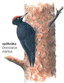
spillkråka Dryocopus marilus

Spillkråkan, vår största hackspett, är lätt att känna igen i sin svarta rock och röda basker. Spillkråkan trivs bäst i skogar med grova tallar eller aspar som den kan hacka ur sitt stora bohål i. När spillkråkan överger sitt hem kan andra hålläckande fåglar flytta in.