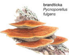
brandticka Pycnoporellus fulgens

Spillkråkan, vår största hackspett, är lätt att känna igen i sin svarta rock och röda basker. Spillkråkan trivs bäst i skogar med grova tallar eller aspar som den kan hacka ur sitt stora bohål i. När spillkråkan överger sitt hem kan andra hålläckande fåglar flytta in.