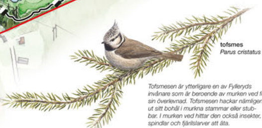
tofsmes Parus cristatus

Tofsmesen är ytterligare en av Fylleryds invånare som är beroende av murken ved för sin överlevnad. Tofsmesen hackar nämligen ut sitt bohål i murkina stammar eller stubbar. I murken ved hittar den också insekter, spindlar och fjärilslarver att äta.